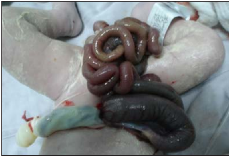
Foto 1. Recién nacido con gastrosquisis. Nótese el defecto de la pared abdominal, es lateral al cordón umbilical y en este caso derecho.

gastroschisis, showing a prevalence of 81.8 per 10,000 and 1 per 122 newborns.