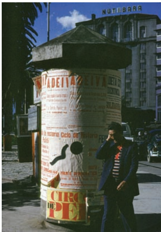
Serie de pictografías urbanas. 1982. Intervención urbana. Impresión litográfica con tinta negra. 50x70 cm.