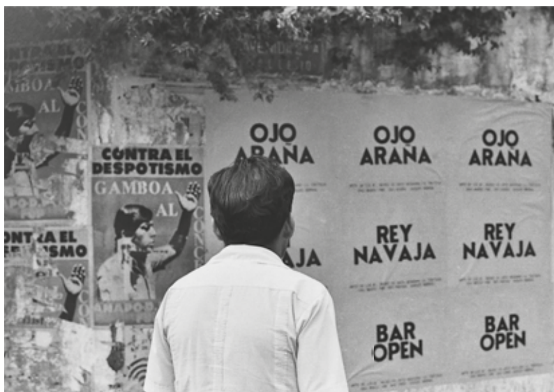
Serie Bar-Open , Rey-Navaja , Ojo-Araña . 1980. Intervención urbana. Impresión tipográfica sobre papel. 50x70 cm.