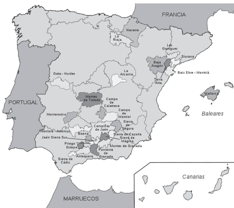
MAPA 1. SITUACIÓN GEOGRÁFICA DE LAS DENOMINACIONES DE ORIGEN DE ACEITE DE OLIVA DE ESPAÑA