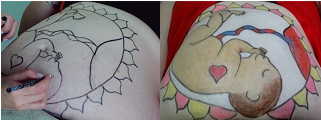
Figura 1 – Sequência de fotos do desenvolvimento da Arte da Pintura do Ventre Materno. Curitiba, PR, Brasil, 2017