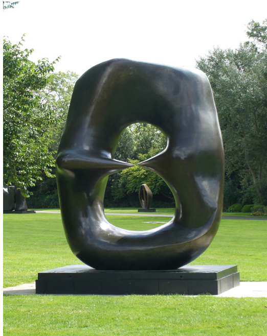
Moore, Henry. Oval with points , 1968. Bronce. Henry Moore Foundation. Perry Green. Hertfordshire.

sustancial, encontramos en El origen del mundo (1924), de Brancusi, un modelo explícito que encuentra su acomodo natural en el organicismo y el materialismo que prepara un posterior despertar simbólico. En este sentido, trabajos como los de Maria Martins o los de Jean Arp son explícitos en lo referente a estas búsquedas, sin dejar de lado la natural existencia de variantes de sentido opuesto como parte de lo que ha de comprenderse como un proceso sistémico. Esta misma intención de formatividad circular la advertimos, por citar algunos otros ejemplos tomados de diferentes expresiones estéticas, en la música de Scriabin, en la de Scelsi, así como, en el ámbito de la literatura y por ceñirnos a un territorio hispanohablante, en la poesía de Juan Eduardo Cirlot. 11