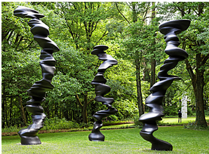
Cragg, Tony. Points of View , (2007). Bronce. Skulpturenpark, Wuppertal.

Llegados a este punto, cabe comprender que la suplantación de un orden eidético por uno sustancial viene, ante todo, a exponer la falta de articulaciones capaces, en un momento dado, de aunar las aparentemente contradictorias aproximaciones a lo que comprendemos como lo real. La nivelación por lo bajo se presenta, visto con perspectiva, como estado natural de todo periodo inicial de renovación de ideas. Si, por una parte, con este giro hacia lo sustantivo nos situamos en la base de un concreto ordenamiento, esto es, en un estrato en que los sedimentos culturales se ven reducidos a su expresión elemental, a su vez sólo desde este necesario grado cero es posible recomponer desde la raíz una imagen del mundo óptima para canalizar tensiones inherentes.