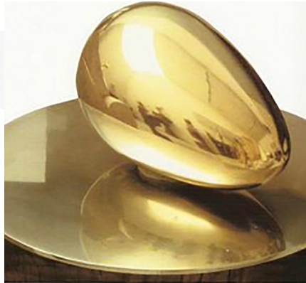
Brancusi, Constantin. Le commencement du monde , 1924. Bronce (tras una versión en mármol de hacia 1920). Centre Pompidou. París.