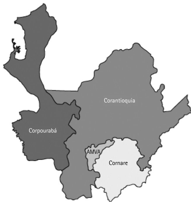
Figura 1. Jurisdicciones territoriales de las CAR en Antioquia