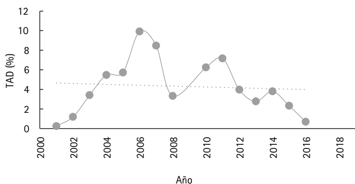
Figura 2. Tasa de descuento para licenciamiento ambiental de Colombia entre 2001 y 2016* (%)