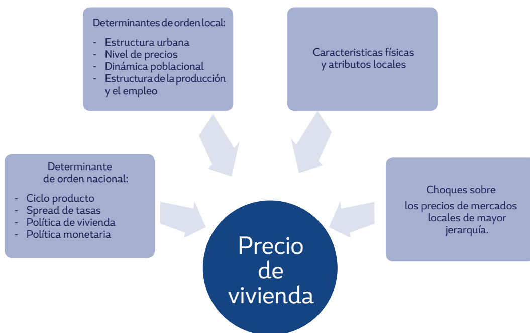
Figura 1. Mercado de vivienda local

Otro tipo de factores que inciden directa o indirectamente en el mercado inmobiliario se ven reflejados en la política macroeconómica de orden nacional. Para el caso de este trabajo, se considera un factor interregional de la formación del precio de las viviendas, el cual no se considera regularmente a la hora de evaluar los precios en los mercados locales de este tipo de bienes. En la Figura 1 se presentan los principales determinantes de la dinámica de los precios y su clasificación.