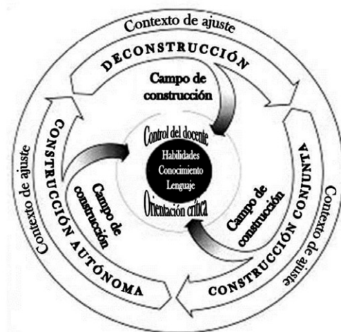
Figura 4. Modelo de enseñanza de la escritura

ciar los procesos de aprendizaje en el aula (figura 4). El modelo busca orientar a los estudiantes en la producción de un texto a partir de las habilidades adquiridas en los procesos de lectura. Por ello adicionan actividades que, con la orientación del docente, fluctúan entre la lectura anticipatoria y detallada, hasta la producción de textos. Básicamente, el proceso pedagógico se presenta alrededor de tres fases principales: la deconstrucción, la construcción conjunta y la construcción autónoma. La primera fase busca poner en evidencia el género al que pertenece el texto, con el fin de visualizar sus partes constituyentes como un todo. La segunda fase propone trazar los lineamientos para un nuevo texto teniendo en cuenta los aportes de los estudiantes. La última fase pone la responsabilidad en manos del estudiante para que elabore un texto por su cuenta, a partir de las reflexiones realizadas. La construcción del campo y el establecimiento del contexto son fundamentales en cada etapa del ciclo, los estudiantes las comprenden como una serie de actividades que les permiten aprender acerca del contenido del género y el contexto en el cual se despliega. De esta forma, el objetivo final del ciclo es orientar de manera controlada y crítica la forma como los autores construyen el género (Martin y Rose, 2005).