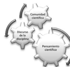
Figura 2. El lenguaje y sus relaciones en la comunidad científica