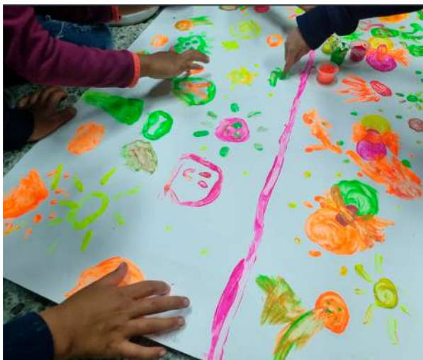
Figura 7. Significación del cambio evolutivo a través de líneas de tiempo

Esta preeminencia a la hora de brindar las primeras experiencias a los niños en contacto con los códigos de las ciencias se logró dinamizando sus saberes previos acerca del cambio evolutivo durante las sesiones de ambientación, para luego propiciar las significaciones más consistentes del contenido. Como ilustración, la Figura 7 muestra el proceso de ubicación de organismos en una línea de tiempo relacionada con las condiciones termodinámicas asociadas a la evolución de lo vivo.