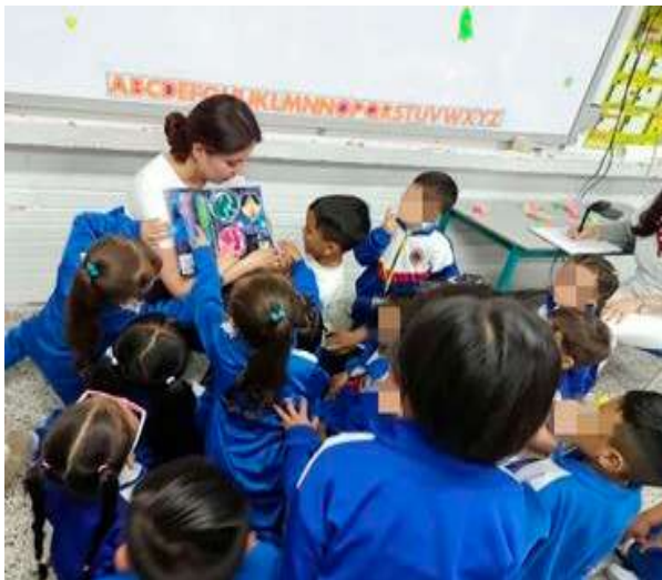
Figura 6. Relacionamiento de niños con el material educomunicativo

Por ello, durante las sesiones de presentación del mensaje educomunicativo se incorporaron actividades por rango etario, que resultaron significativas para los niños en su aproximación al contenido cultural específico. Esto permitió que se relacionaran con el conocimiento astrobiológico y este fuera verosímil para ellos y ellas. En la Figura 6 se observa una situación de trabajo con el grupo de preescolar del Semillero Astrochikis Club.