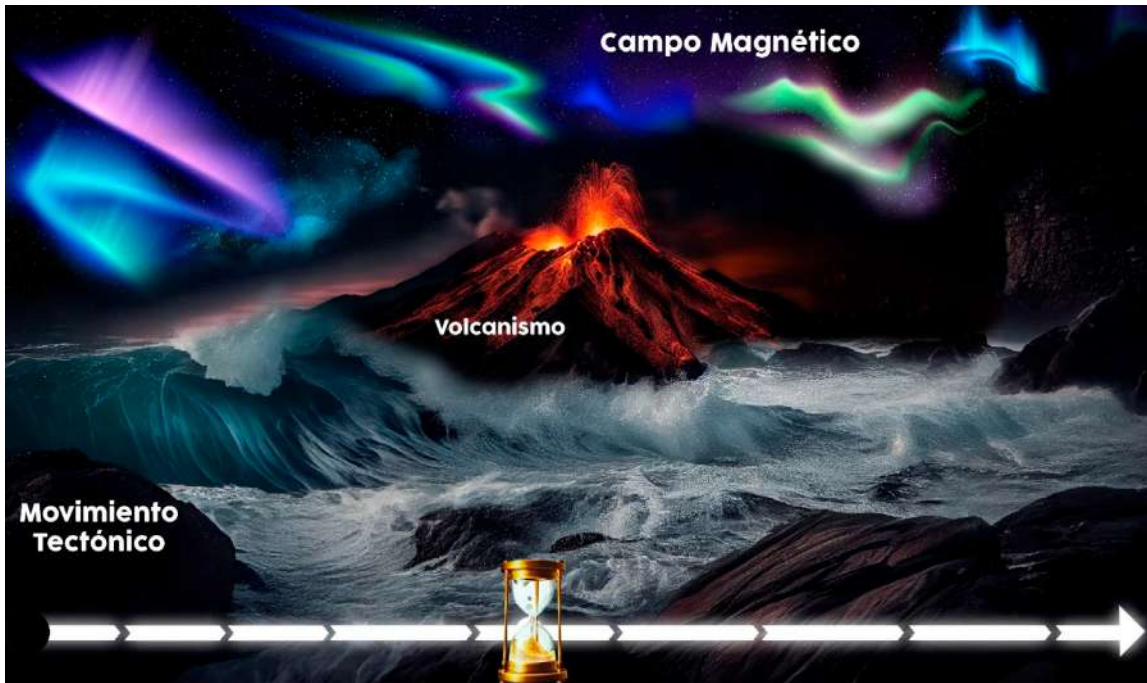
Figura 3. Uso de línea y alegoría asociada al tiempo