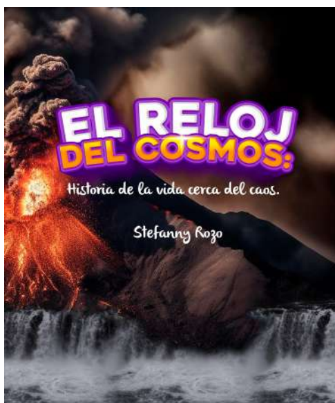
Figura 1. Portada y contraportada del material educomunicativo

Esta investigación halló como determinante la experiencia y saberes que los niños del curso transición van consolidando a partir de su participación en Astrochikis Club, en el proceso de creación y validación del texto divulgativo. Así, se encontró que desde su ingreso al semillero los niños manifiestan un interés abierto y genuino por los fenómenos naturales, incluidos los astronómicos. A través de las actividades se evidenciaron conocimientos previos que, aunque fragmentarios, pueden operar como anclajes culturales para la comprensión de conceptos más elaborados y complejos. Evidencia de esto es que durante la fase de observación se documentaron diferentes situaciones en las que ellos lograban relacionar los contenidos científicos abordados con experiencias cotidianas, como comparar la actividad de los volcanes con el calor de una olla a