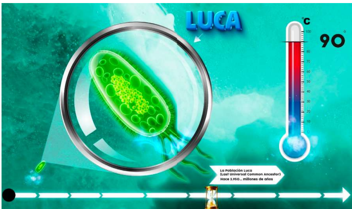
Figura 4. Página del texto en la que se presenta el último ancestro común universal (LUCA, por sus siglas en inglés)