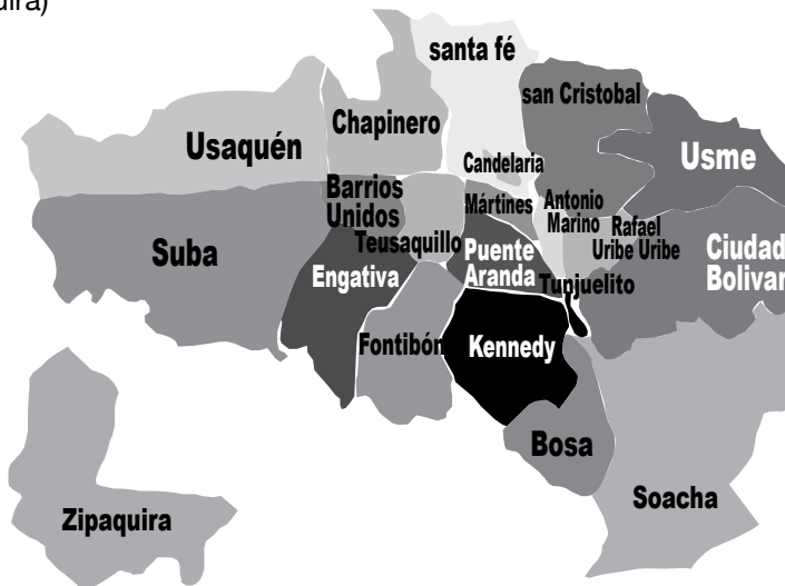
Gráfico 3. Mapa de diecinueve localidades de Bogotá y dos municipios (Soacha y Zipaquirá)

En el marco de este proyecto se recolectó información de diecinueve localidades de Bogotá (Antonio Nariño, Barrios Unidos, Bosa, Candelaria, Chapinero, Ciudad Bolívar, Engativá, Fontibón, Kennedy, Mártires, Puente Aranda, Rafael Uribe, San Cristóbal, Santafé, Suba, Teusaquillo, Tunjuelito, Usaquén y Usme) y dos municipios de Cundinamarca cercanos a Bogotá (Soacha y Zipaquirá) (ver Gráfico 3). Estas alternativas se pre-seleccionaron a partir de las