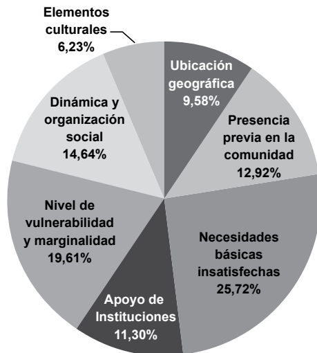
Gráfico 4. Ponderación para cada uno de los criterios