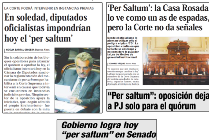
Imagen 1. Encuadre 'Disputa político-institucional' en la cobertura del "7D" en Ámbito Financiero y El Cronista Comercial .