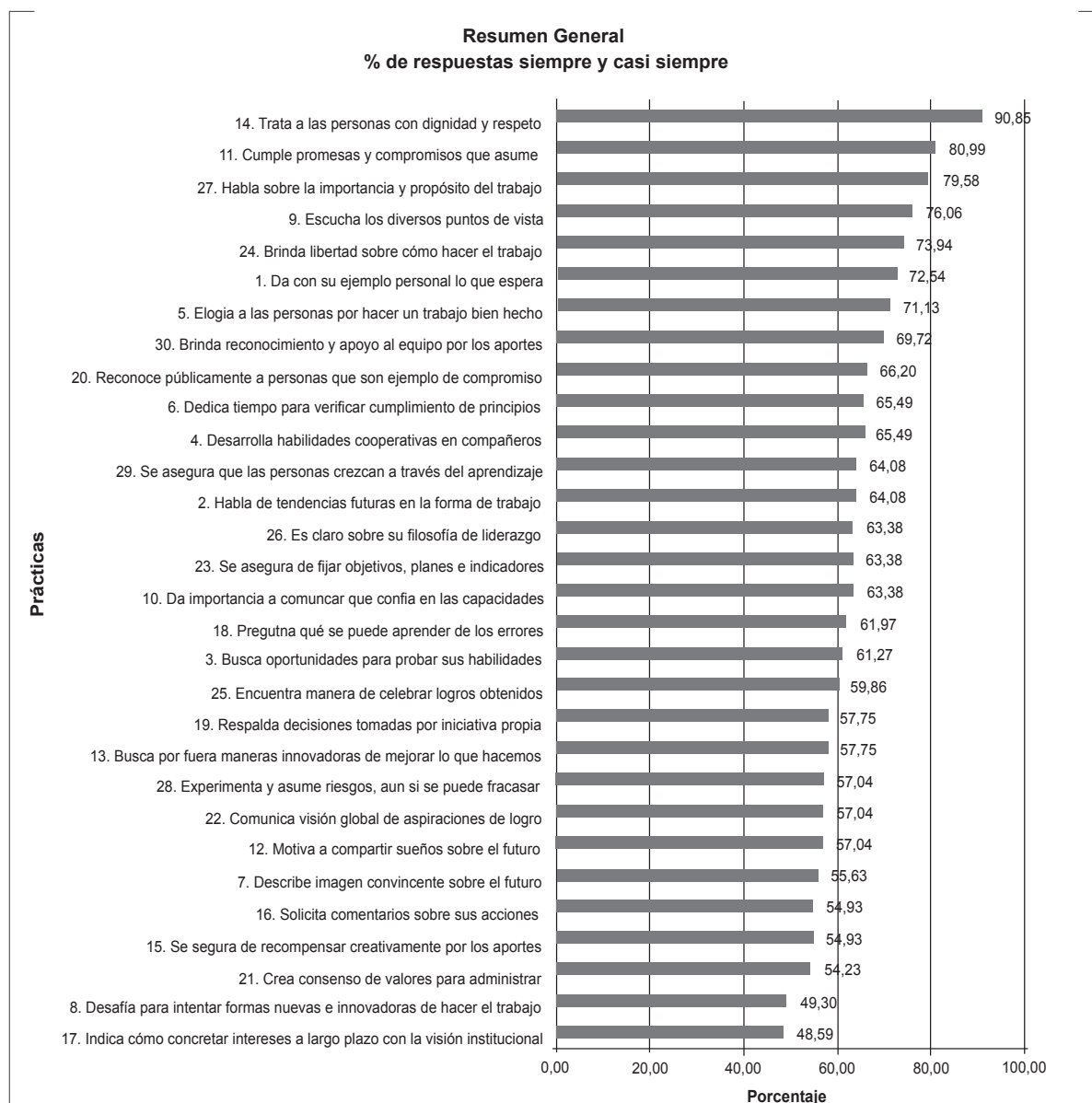
Figura 2. Aceptación de comportamientos LPI

Por lo anterior, se valida y acepta la hipótesis H2: En la gerencia universitaria están presentes elementos del liderazgo transformacional , específicamente, que los seguidores de los directivos de la Facultad de Medicina en general perciben los comportamientos planteados en el instrumento