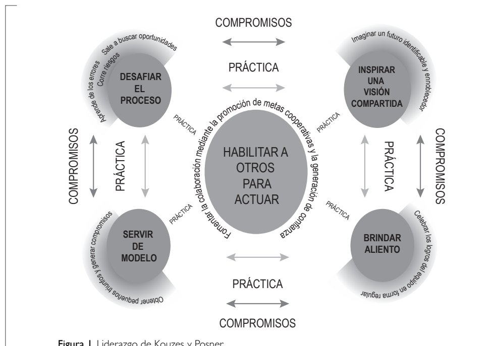
Figura 1. Liderazgo de Kouzes y Posner.

En relación con su contenido, el formulario, inicia con el título IPL evaluación, seguido de unas cortas y sencillas instrucciones, la presentación de la escala de calificación que va de 1 (casi nunca) a 10 (casi siempre), pasando por el 5 (neutro, ocasionalmente). Luego aparecen listadas las 30 preguntas, en las que se manifiestan las conductas del líder, correspondientes a las cinco dimensiones del liderazgo así: Modelar el camino; Inspirar una visión compartida; Desafiar el proceso; Habilitar a los demás para que actúen; Alentar el corazón. El formulario IPL puede ser adquirido a través del sitio http://www.wiley.com/ .