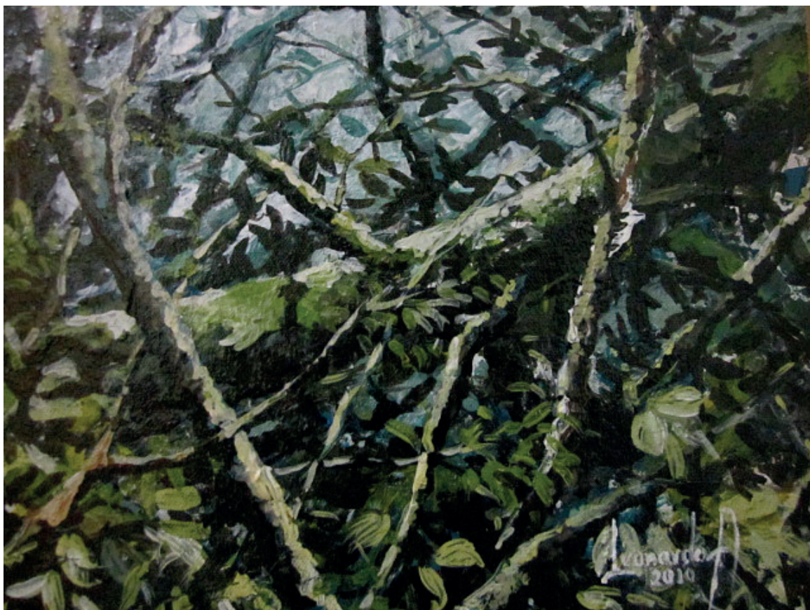
Trama de bosque 5 Esmalte sobre tela 27 x 29 cm 2014 Medellín