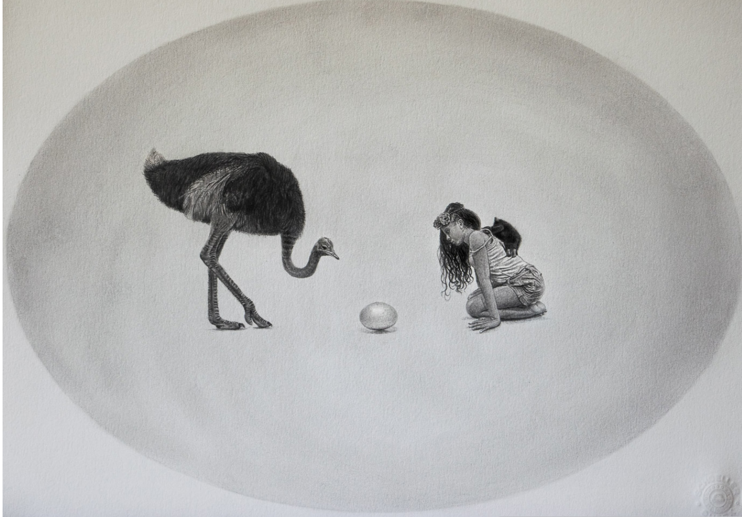
Sin título De la serie Un viaje hacia el origen Grafito sobre papel 25 x 35 cm 2019 Medellín