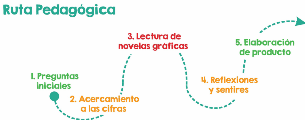
Figura 1 Ruta pedagógica propuesta para los clubes de lectura

Momento 1. Preguntas iniciales: en este se estableció una serie de preguntas para que el estudiantado se acercara al impacto del conflicto armado que abordaría la novela (desplazamiento, jóvenes en la guerra, violencia sexual en el marco del conflicto etc.) y, de esta manera, también acercarlos al desarrollo del pensamiento crítico, ya que como lo plantea Aymes (2012) la indagación permite establecer puntos de partida desde donde docentes y estudiantes pueden identificar el dominio que tienen de ciertas temáticas y llegar a ideas novedosas. Además de promover el pensamiento metacognitivo y reflexivo (p. 42).