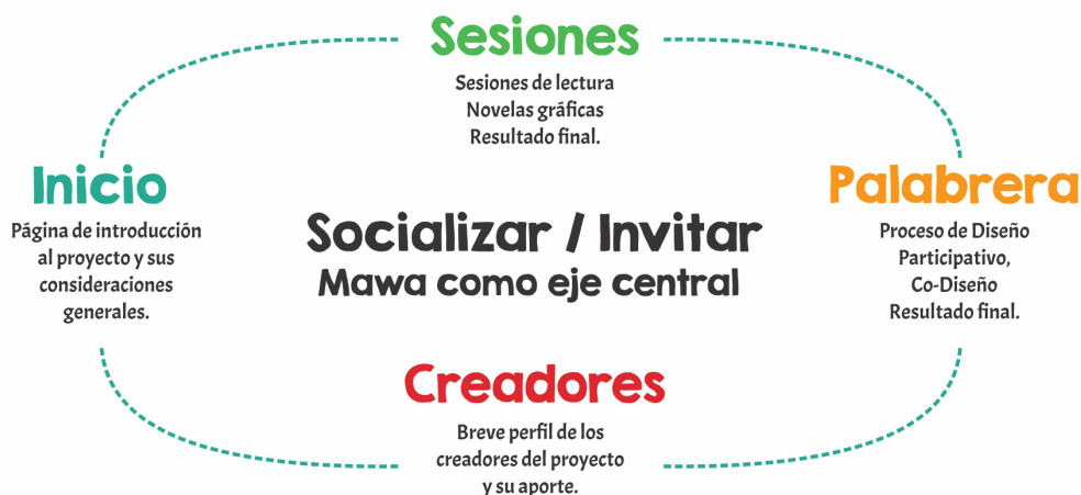
Figura 5 Estructura de diseño participativo

Cabe aclarar que este último producto se encuentra aún en desarrollo y solo se llegó a la primera fase, en la que la propuesta formal se acercó a un prototipo web funcional (navegable), apoyándose en versiones libres del software Figma.