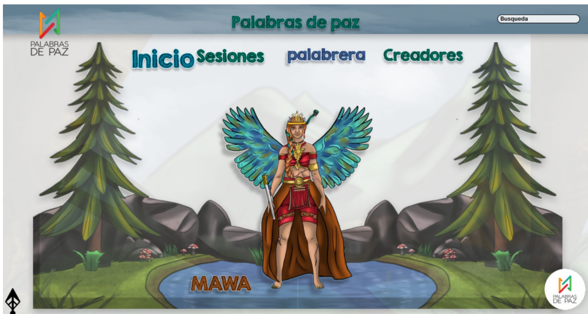
Figura 4 Interfaz prototipo web

Para estructurar la navegación dentro de este espacio virtual (prototipo web), se consideró la posibilidad de acceder fácilmente a la información, tanto del proceso como de los creadores, de modo que se pudiera evidenciar y consultar los resultados de las reflexiones generadas en las sesiones del club de lectura junto al material usado (de uso libre). Estas decisiones y el proceso de Diseño Participativo se obtuvieron a partir de la siguiente estructura conceptual.