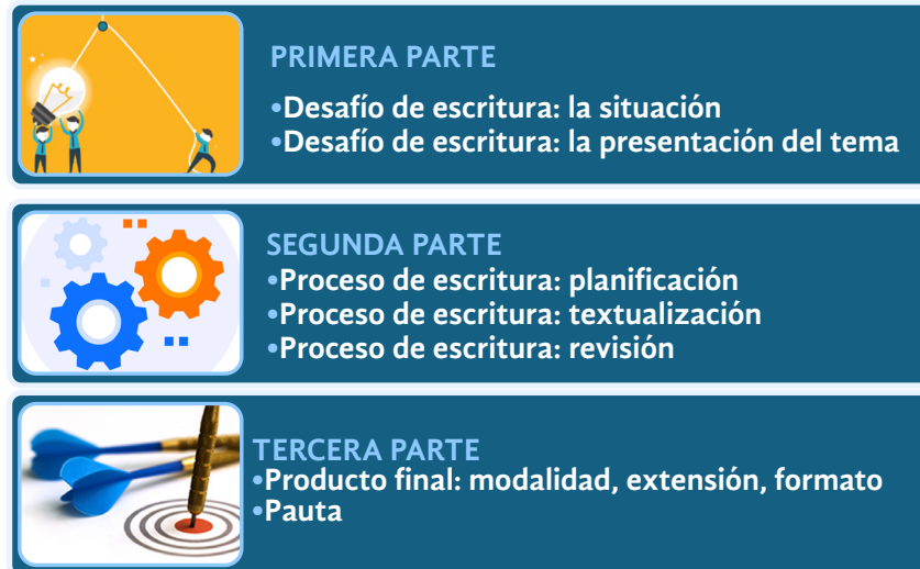
Figura 2 Etapas consideradas en el dispositivo de trabajo