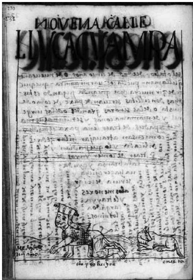
❖ FIGURA 5 “NOVENA CALLE, LLVCAC VAMRA [niña que gatea]”.

El asunto resulta problemático, pues la vinculación entre la ropa y los ritos de pasaje de la primera infancia a la adultez, así como las implicancias de esas categorías generacionales, son temas aún insuficientemente estudiados. Lo cierto es que una de las dimensiones claves de la socialización debió ser, justamente, la adopción de la vestimenta de hombre y de mujer y, con ello, el uso del chumpi femenino 10 .