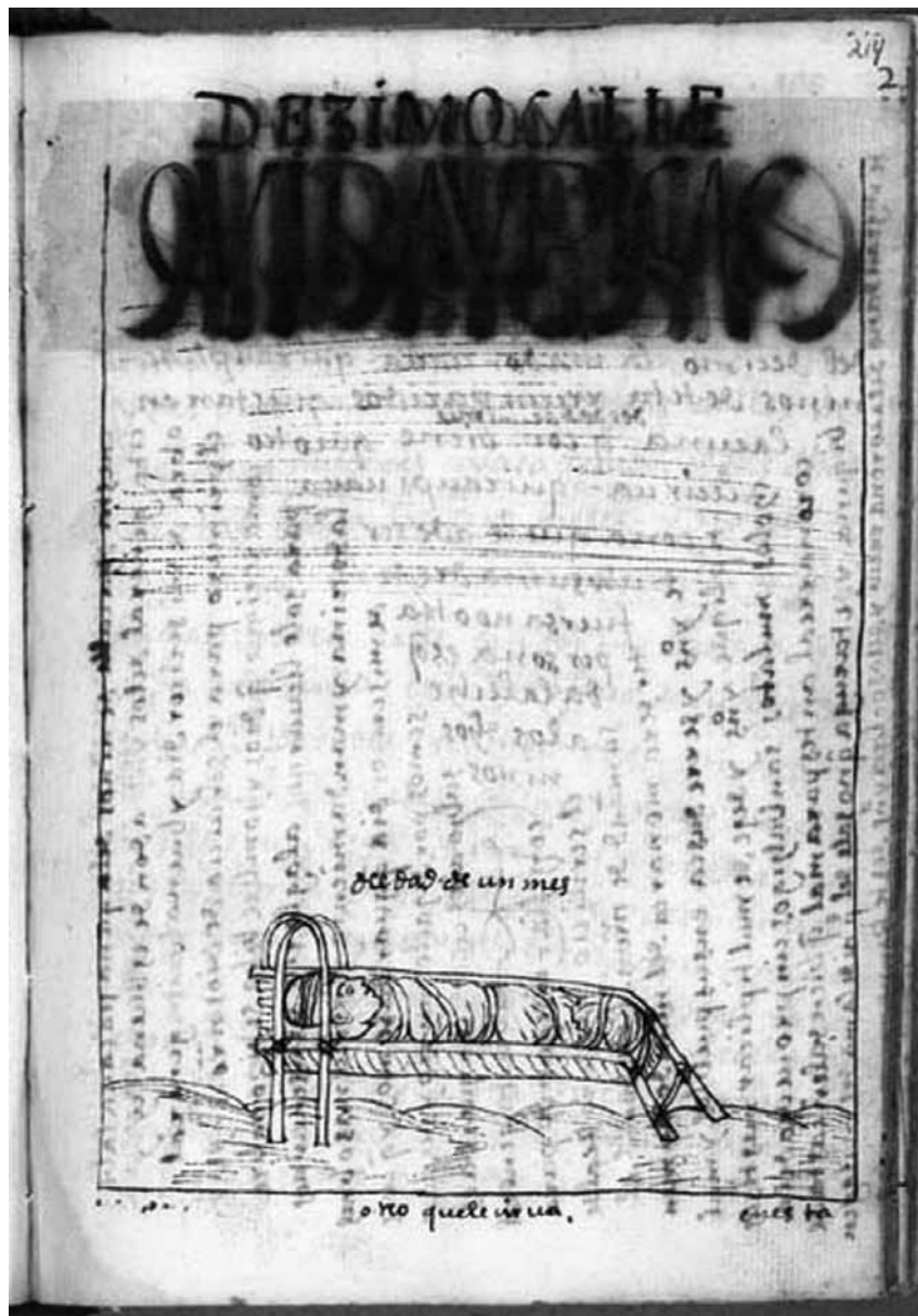
⇨ FIGURA 2 “DÉZIMO CALLE, QVIRAVPI CAC [de cuna]”.