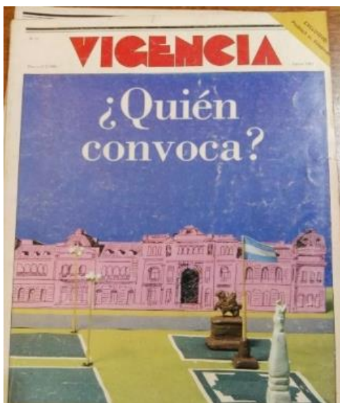
Figura 1. Tapa de Vigencia , n.º 51, agosto de 1981.