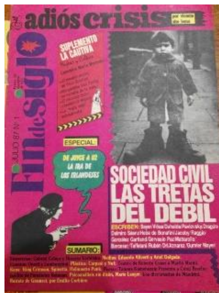
Figura 4. Tapa de Fin de siglo , n.º 1, julio de 1987