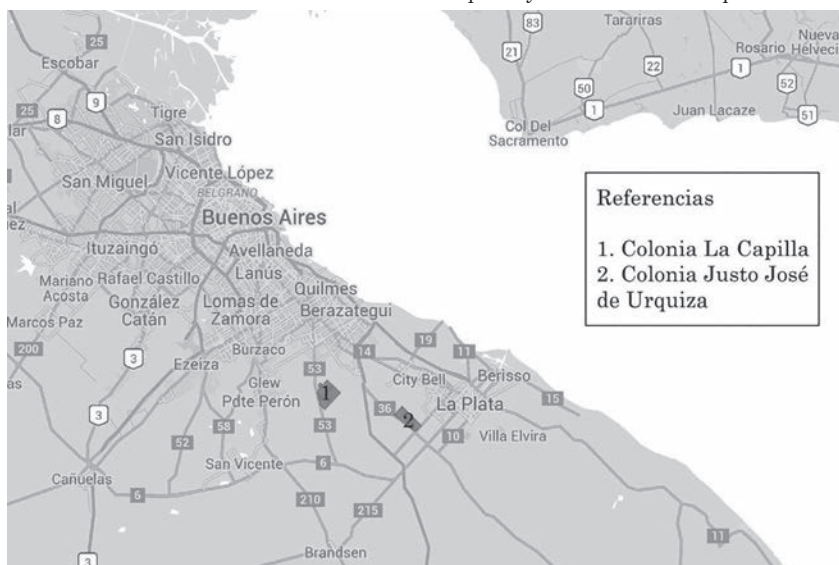
Gráfico 1. Ubicación de “Colonia La Capilla” y “Justo José de Urquiza”