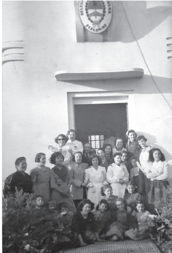
Imagen 4: Censo en Anchorena de Urquiza (Pergamino, c.1950)

requería nuevas formas de liderazgo 62 . De hecho, otra UBF, situada en el mismo local que la de las hermanas García, fue inaugurada el 20 de julio de 1951.