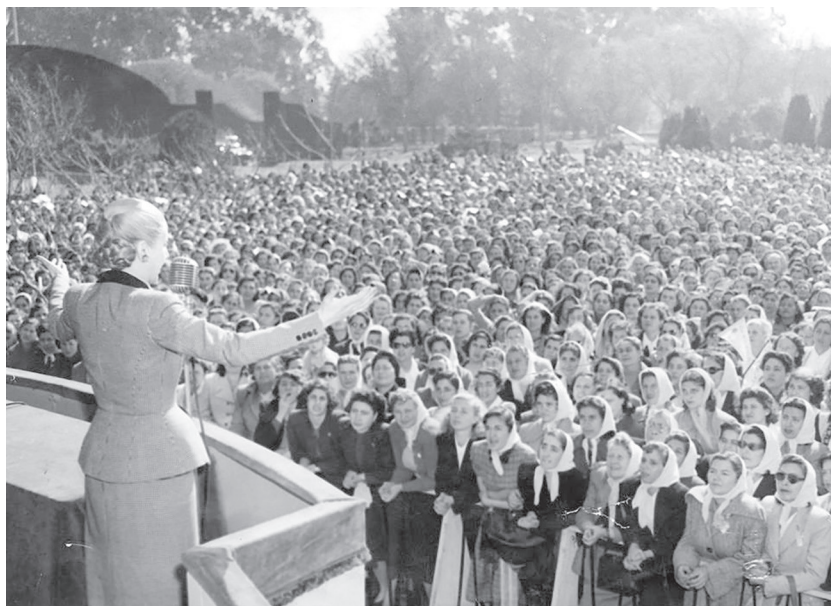
Imagen 1: Eva Perón y militantes, 1951