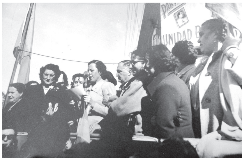
Imagen 2: Acto de inauguración de la primera Unidad Básica Femenina de Pergamino, 26 de junio de 1950.