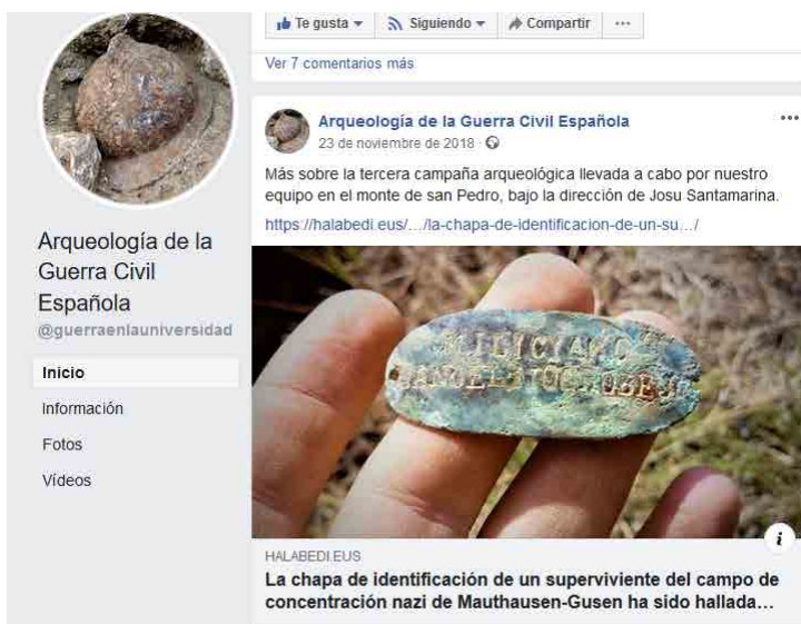
Imagen nº 6.- Página en Facebook de @guerraenlauniversidad

General Miaja; @TerraEnlla y @BatalladelEbro son perfiles que muestran rutas por la batalla del Ebro; @soldadodegleba enseña senderos por la historia del conflicto al igual que @RutasdeGuerra, @ARAMA.36.37, @rutasbelicas o Madrid en guerra. Itinerarios guiados por el Madrid de la Guerra Civil . La página de Facebook de @guerraenlauniversidad es gestionada por un equipo de arqueólogos que está revelando con gran exactitud las trincheras y líneas defensivas en las batallas de la Ciudad Universitaria y Moncloa, aportando planos, fotografías y todo tipo de imágenes que acercan a los usuarios a la realidad del enfrentamiento ocurrido en la zona. Del mismo modo @asociaciontajar, descubre la situación de los ejércitos en los territorios de la batalla del Jarama; Los Refugios de la guerra civil de Almería anima al conocimiento de dichos refugios tan importantes para la defensa republicana; o Salvar los restos de la Guerra Civil , enseña los existentes en la zona de Majadahonda y Las Rozas con el propósito de conservarlos y prepararlos para las visitas didácticas guiadas por los itinerarios de las batallas alrededor del frente de Madrid.