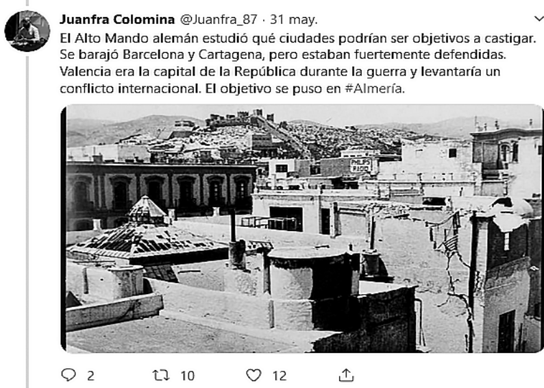
Imagen nº 5: Tweet en el Hilo creado por @Juanfra_87 sobre el bombardeo de Almería

el hilo de tweets de Juanfra Colomina (@Juanfra_87) sobre el bombardeo de Almería en el que se comparte todo el proceso que provocó el ataque a la ciudad, la destrucción de edificios y la muerte de varias personas 42 .