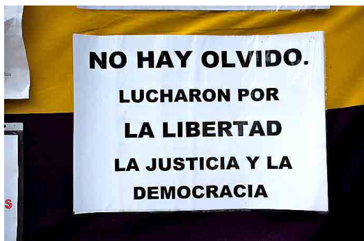
Imagen n° 2. Cartel en el Homenaje a las Víctimas del Franquismo, Madrid, 2017.

La idea señalada de «resistencia al olvido» está implícita en todas las cuentas analizadas, aunque no figure esta expresión en la sección «Inicio» de las mismas. En la cuenta de Twitter @FosaAfa su presentación es la frase de Antonio Machado «Late corazón ... No todo se lo ha tragado la tierra» 35 . En @NombresPorcuna han tomado como lema de apertura la afirmación de Milan Kundera: «La lucha del hombre contra el poder es la lucha de la memoria contra el olvido» 36 . En sus contenidos recurren a los hechos y personajes del pasado marginados de la historia oficial de la dictadura y del relato transmitido en la democracia, con la finalidad de recuperarlos para el presente, si bien el modo de alcanzar esta meta varía según quién sea la institución promotora de la cuenta.