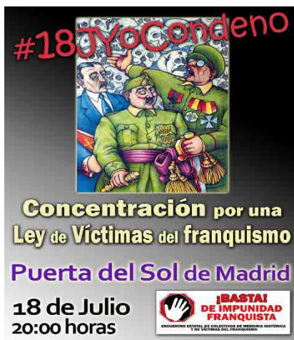
Imagen nº 4.- Cartel de la Campaña de 2018 @18JYocondeno Encuentro Estatal de Colectivos de Memoria Histórica y Víctimas del Franquismo.

Muchos colectivos conforman grupos abiertos en los que se anima a la participación en las actividades que convocan al apoyo en campañas promovidas solicitando un tratamiento justo a las víctimas de la Guerra Civil y la dictadura franquista. Una de estas campañas es la organizada por la Federación Estatal de Foros por la Memoria con el hashtag #18JYoCondeno para los días anteriores al 18 de julio, con el propósito de que se declare Día de Condena del Franquismo. Esta operación proponía diferentes textos de tweets y cuentas a fin de alcanzar la máxima difusión posible.