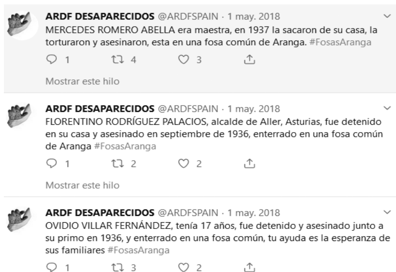
Imagen nº 3. Relación de tweets de la cuenta @ARDFSPAIN