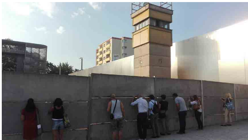
Imagen de la torre de vigilancia y espacios originales del Memorial del Muro de Berlín. La amalgama de sistemas de reinterpretación y transmisión consiguen un aprendizaje positivo.