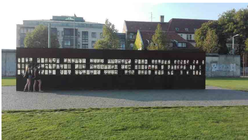
Imagen del espacio de interpretación del Memorial del Muro de Berlín dedicado a los testimonios y las víctimas.