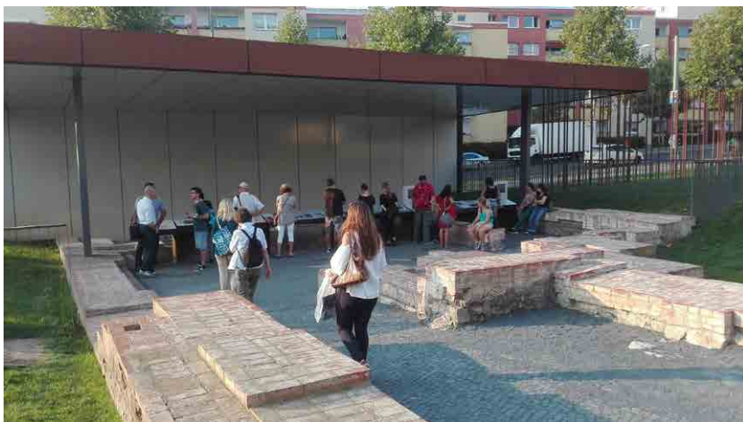
Imagen de la parte de la visita del Memorial del Muro de Berlín, recuperación de restos arqueológicos y espacio de información e interpretación, así como podemos ver una parte de reinterpretación en barros de hierro corten del propio muro.