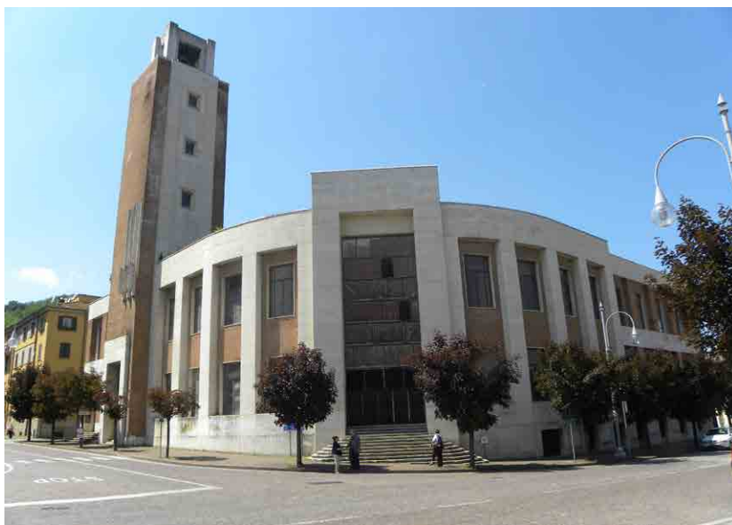
Imagen: Casa del Fascio en Predappio. Edificio donde se debe ubicar el nuevo Museo Memorial sobre el Fascismo.

Predappio está pues en medio de la polémica, algunos comienzan a defender que se haga derruir la casa del Fascio y se olvide el proyecto. Tal vez, hacerlo sería dar la razón a aquellos que ya tienen su lugar físico y simbólico de peregrinación en Predappio y se les concedería la exclusiva. Tienen la casa museo y tienen el panteón privado. Quizás que el resto de ciudadanos podamos disponer pronto de un espacio de aprendizaje, reflexión y análisis crítico de lo que fue uno de los orígenes de las catástrofes del siglo XX, pero la política y sus derivas sentenciarán, una vez más, a ese lugar a la polémica constante.