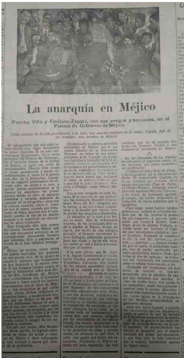
Figura 1. Columna «La anarquía en Méjico. Pancho Villa y Emiliano Zapata con sus amigos y secuaces en el Palacio de Gobierno de Méjico».