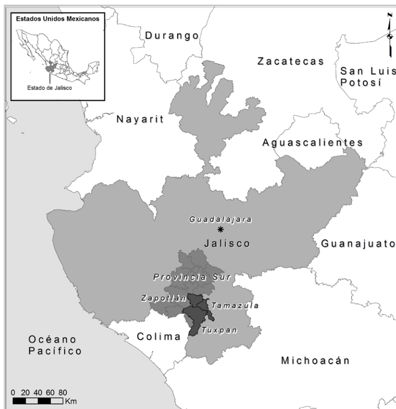
Mapa 1. Mapa de Jalisco.