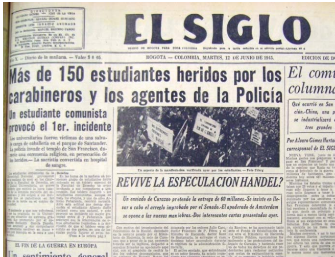
Titular de El Siglo refiriéndose a los enfrentamientos entre los estudiantes y la policía en Bogotá en junio de 1945.