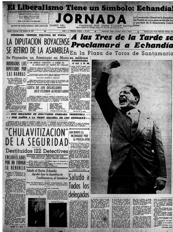
Imagen 3 Jornada, 2 de octubre, 1949.

talante del diario, por lo menos en las primeras planas: concursos de belleza, estrellas de cine, deporte y fenómenos llamativos y superfluos. 46