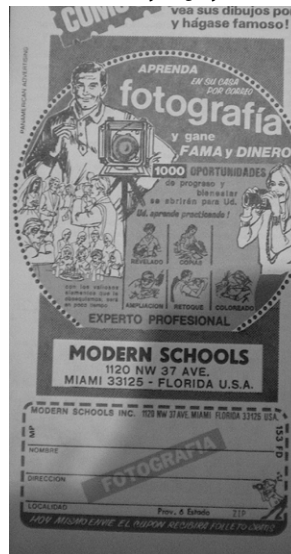
Figura 4. Publicidad curso de fotografía en las Modern School