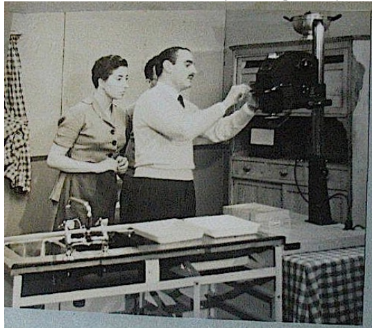
Figura 7. Publicidad televisada de la mujer en los procesos fotográficos