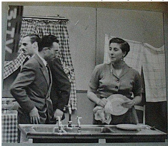
Figura 8. Publicidad televisada de la mujer en los procesos fotográficos