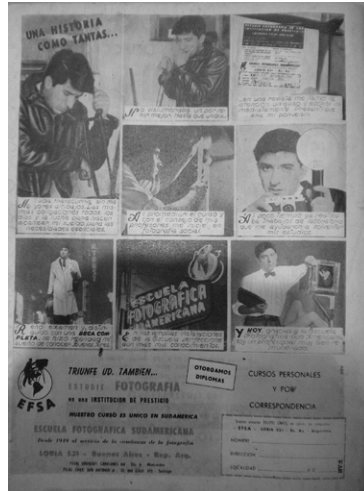
Figura 9. Publicidad de curso de fotografía

tomar la fotografía y que se distanciaba mucho de solo apretar el botón. Las otras imágenes de la publicidad integradas por una ampliadora o una cámara con trípode —aparentemente una cámara cinematográfica— también eran referencias a la profesión de fotógrafo. En general, desde los discursos publicitarios, la profesión de fotógrafo era una opción solamente masculina. Un anuncio de 1960 de la EFSA en formato de historieta a página entera narraba “una historia como tantas”: la de convertirse en fotógrafo profesional (figura 9).