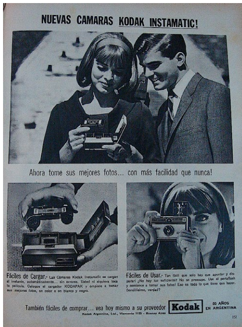
Figura 3. Publicidad Kodak Instamatic