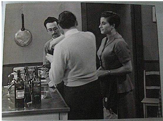
Figura 6. Publicidad televisada de la mujer en los procesos fotográficos