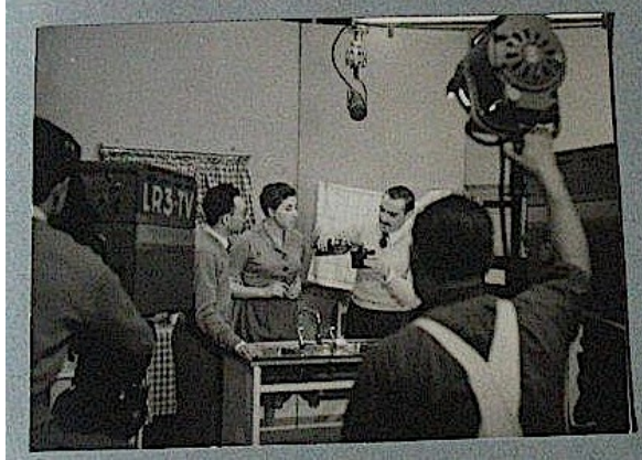
Figura 5. Publicidad televisada de la mujer en los procesos fotográficos