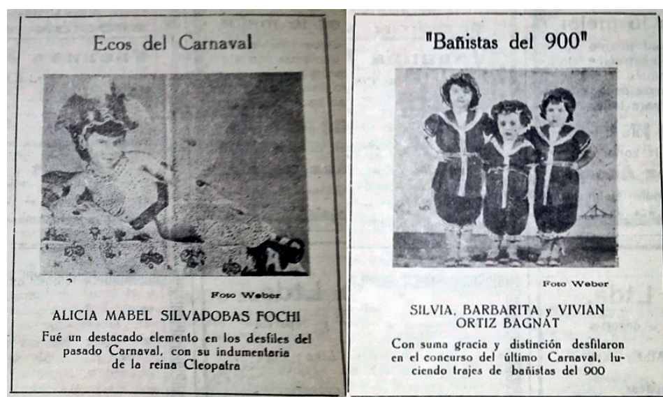
Figura 3. Niñas participantes en el concurso de disfraces del carnaval, 1950

El jurado valoraba la confección, pero también el desenvolvimiento: picardía, candor, ternura y desenfado eran solo algunas lecturas posibles de la prensa sobre la performance infantil. Por eso era frecuente que se ofrendaran opiniones sobre la actitud de los niños, mientras se valoraba positivamente que recitaran con entusiasmo coplas o poemas, si estaban o no “en personaje”, si las niñas eran, tal vez, demasiado pizpiretas. 17