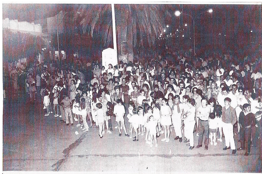
Figura 2. Niños(as) y familias en las calles céntricas, en época de carnaval, 1960