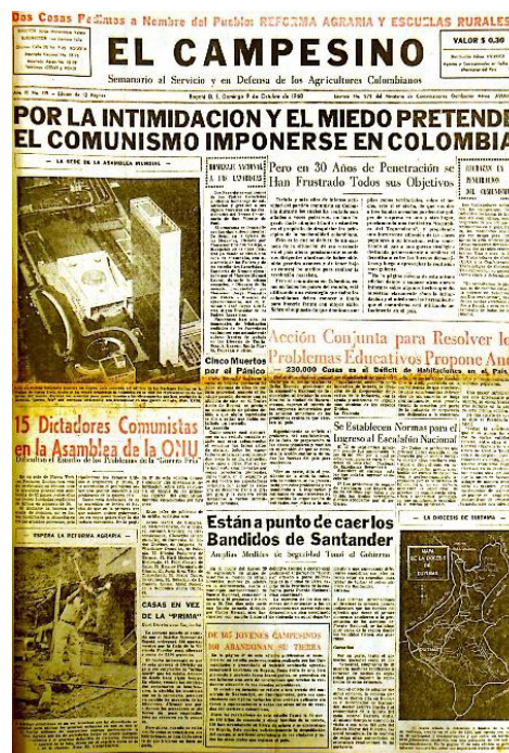
Figura 3. Portada del 9 de octubre de 1960