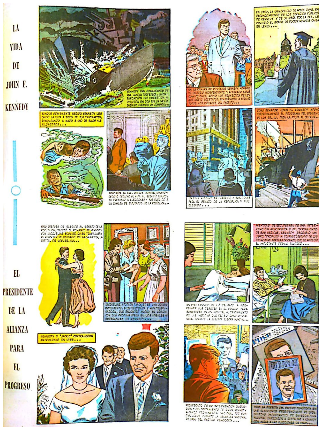
Figura 5. Tira de prensa sobre John F. Kennedy del 11 de marzo de 1962 22