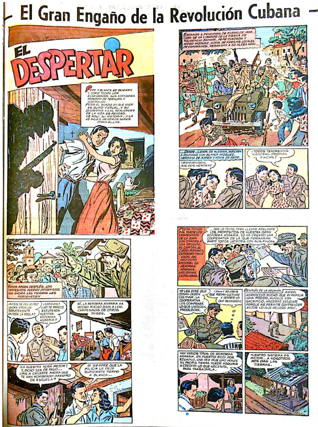
Figura 6. Tira de prensa sobre la revolución cubana del 29 de octubre de 1961