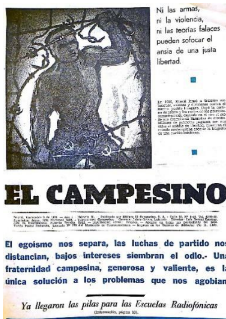
Figura 4. Portada del 2 de noviembre de 1958