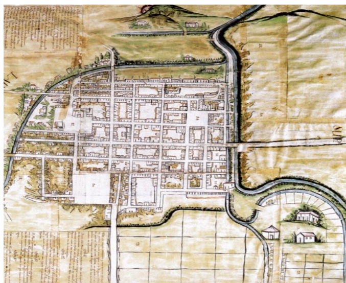
Figura 1. Plano de Zamora de 1803

Una de las motivaciones de este reglamento 13 fueron las múltiples quejas que debía atender el ayuntamiento, provenientes de algunos dueños de tierras, unos por falta de aguas y otros por perjuicios. 14 La obligación de la limpia de la acequia del Águila que correspondía al ayuntamiento pasó a los regantes para que la corporación se encargara de la “vigilancia que le corresponde conforme á sus facultades”. 15 Para la limpia de la acequia fueron distribuidas 17 764 varas entre 16 personas, entre quienes figuran apellidos de los que se tiene registro desde 1889, cuando pertenecían al grupo de grandes propietarios del distrito de Zamora (Verduzco 1992, 73). 16 Una situación similar fue la de algunos miembros de quienes debieron encargarse de la limpia de la acequia del desagüe, cuyas 6606 varas de limpia se dividieron en 42 propietarios.