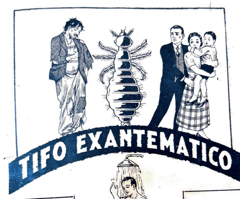
Figura 1. Tifus exantemático

Fuente: "Tifo exantemático", portada Folleto Divulgación (1933).