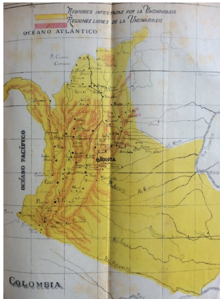
Figura 1. Regiones infectadas de uncinariasis