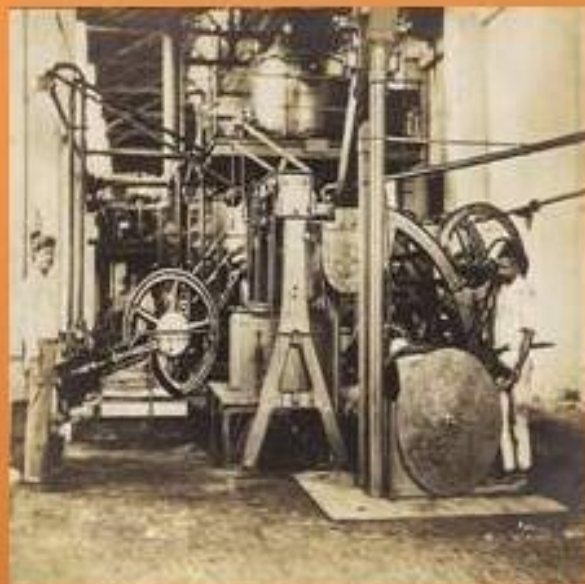
Centrifuga para la fábrica instalada en 1901