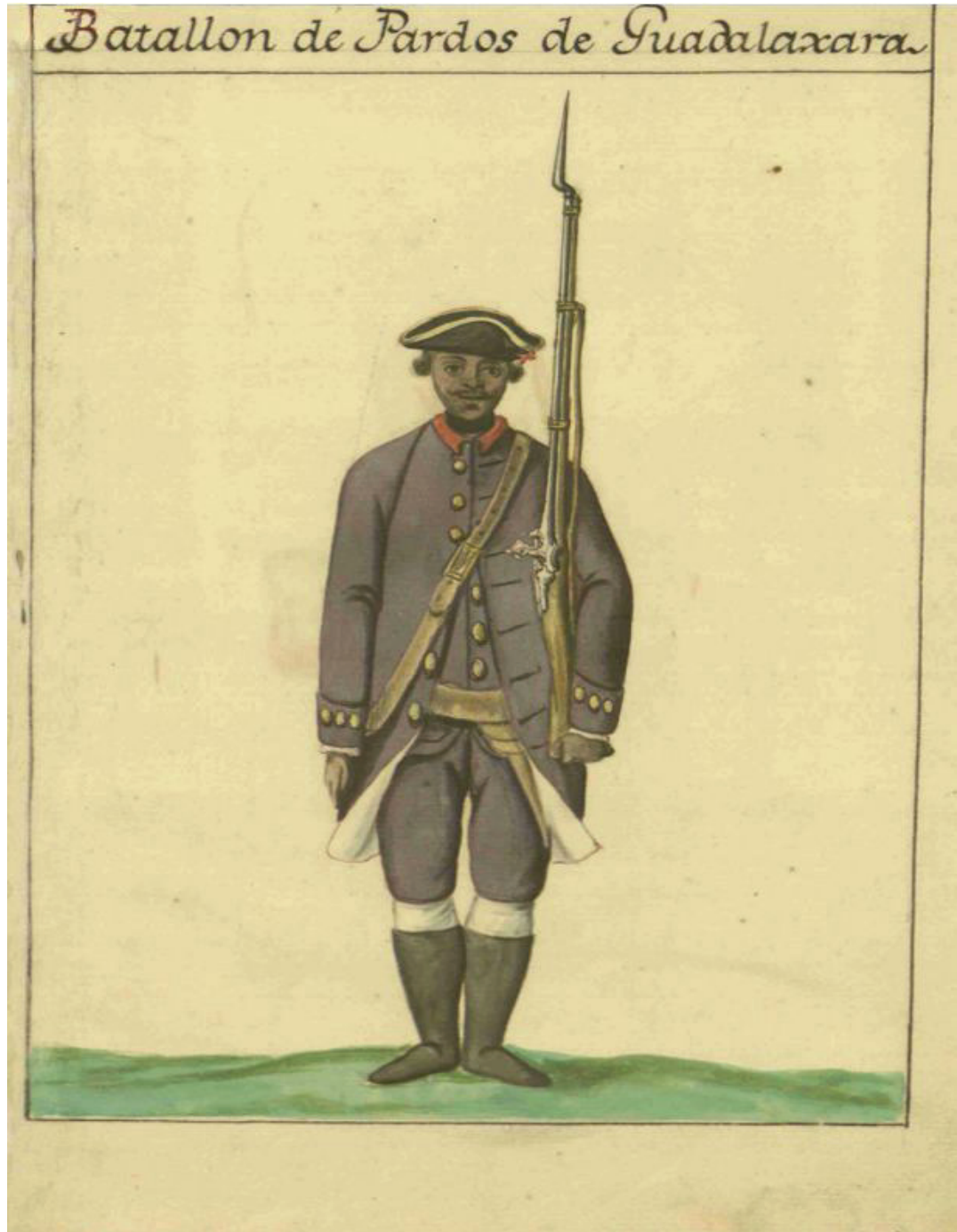
Figura 1. Uniforme del Batallón de Pardos de Guadalajara 1771

Fuente: AGN, Correspondencia de Virreyes, 1ª. serie, vol. 18, f. 127. Fecha: 1771.