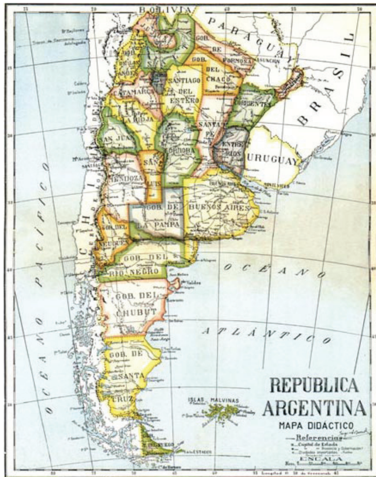
Figura 1. República Argentina, provincias y gobernaciones

Blanca fue concebida como el centro político y administrativo ideal de las tierras que por entonces conformaban las gobernaciones de La Pampa, Río Negro y Neuquén (ver figura 1 y 2). Aunque fallidos, estos planes geopolíticos y su correlato económico, aportaron a la representación de la ciudad como organizadora de la región austral a la vez que movilizaron acciones vecinales assembleístas de considerables proporciones en las que intervinieron la prensa, la mayor parte de las organizaciones de la sociedad civil y las corporaciones económica, profesional, religiosa y militar.