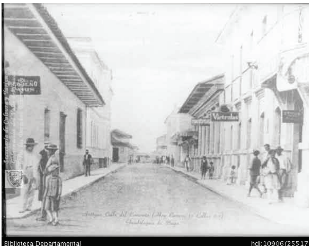
Figura 1. Antigua calle del Comercio, Buga, 1900