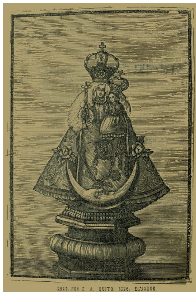
Figura 1. La Virgen del Quinche