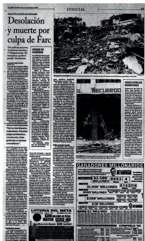
Fuente: El Espectador, diciembre 8 de 2000