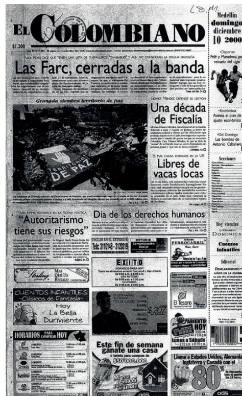
Figura 4. Marco borroso y subexposición de la imagen