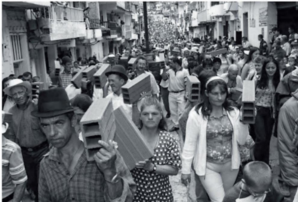
Diez meses después de la toma armada de la guerrilla de las Farc que destruyó cerca de 250 viviendas y dejó 7 policías y 18 civiles muertos, la población de Granada con apoyo de la gobernación de Antioquia, realizaron la marcha del ladrillo para reconstruir su pueblo. Granada, Octubre de 2001.

octubre de 2001.