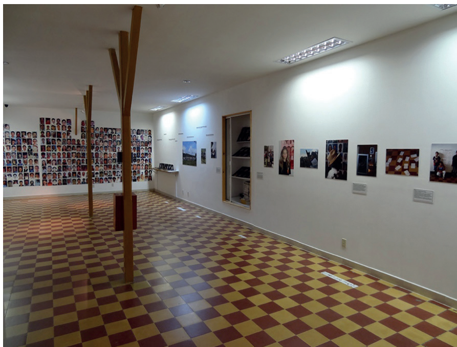
Figura 1. Panorámica del primer piso del Salón

Fotografo: Elkin Rubiano, Granada (Antioquia, Colombia), 2015