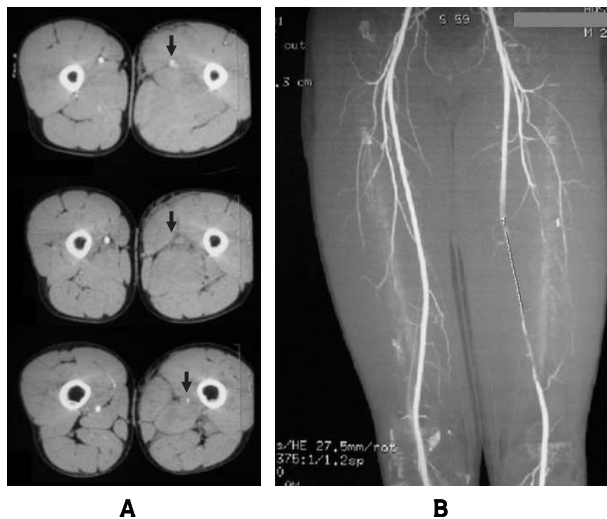
Figura N° 1 ANGIOTOMOGRAFÍA DE LOS VASOS FEMORALES CON MULTIDTECTORES. A. CORTE TRANSVERSAL QUE MUESTRA INTERRUPCIÓN DEL FLUJO EN LA EXTREMIDAD LESIONADA. B. RECONSTRUCCIÓN GENERADA A PARTIR DE LAS IMÁGENES TRANSVERSAS EN LA QUE SE OBSERVA AMPUTACIÓN DE LA ARTERIA FEMORAL CON RECONSTITUCIÓN DEL FLUJO

crónica con sensibilidad y especificidad superiores al 90% para diagnosticar estenosis y oclusión. 36-39 Willman y colaboradores reportaron sensibilidad y especificidad de 96% y 97%, respectivamente, en la detección de estenosis arteriales de los miembros inferiores hemodinámicamente significativas. 40 Distintos autores coinciden en presentar la angiotomografía con multidetectores como un método diagnóstico efectivo en la evaluación de la enfermedad arterial periférica, como alternativa a la angiografía con sustracción digital lo que permite afirmar que este estudio se ha constituido en una herramienta diagnóstica mejor que la arteriografía convencional para el diagnóstico de la enfermedad arterial oclusiva periférica. 41-43