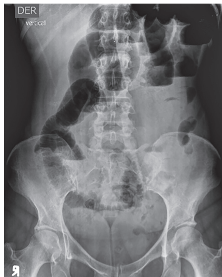
Figura 1. Radiografía de abdomen en posición vertical. Distensión de asas, niveles hidroaéreos y ausencia de aire en el recto

secundaria a una masa estenosante del ciego; se realizó hemicolectomía derecha con anastomosis látero-lateral del íleon al colon transverso con sutura mecánica, sin complicaciones (figura 3). El examen histológico reveló endometriosis que involucraba la serosa y la muscular propia del ciego; medía 3 x 2 cm de diámetro y había reacción inflamatoria adyacente, que generaba obstrucción crítica de la luz intestinal (figuras 4a y b).