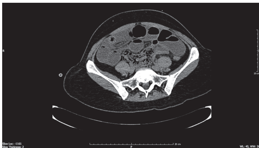
Figura 2. Tomografía de abdomen simple. Distensión de asas del intestino delgado y zona de transición en el íleon distal, con escaso líquido libre en la fosa ilíaca derecha, pero sin masas