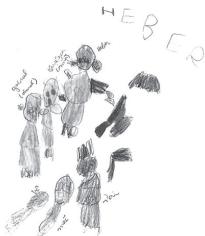
Figura 5. Dibujo libre de Margarida, 6 años