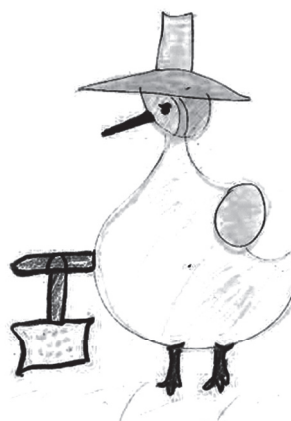
Figura 2. Dibujo libre de Orquídea, 9 años