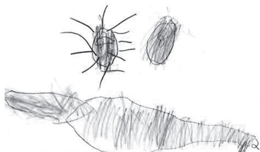
Figura 3. Dibujo libre de Cravo, 7 años