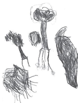
Figura 4. Dibujo libre de Cravo, 7 años