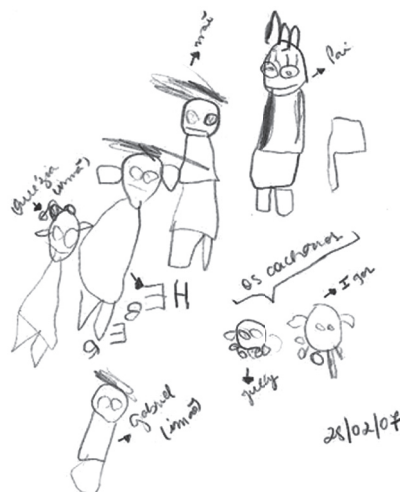
Figura 6. Dibujo libre de Margarida, 6 años