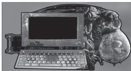
Figura 1. La película The Matrix

consistieron en recorridos arquitectónicos o entrenamientos para el manejo de aeronaves, pero las publicaciones en el tema han mencionado una gran cantidad de posibilidades que en algunos casos llegan a caer en la ciencia-ficción (Stuart, 1996). De hecho la realidad virtual se ha popularizado gracias a películas como el reciente filme The Matrix , representada en la Figura 1, que involucraba a los actores en una realidad simulada.