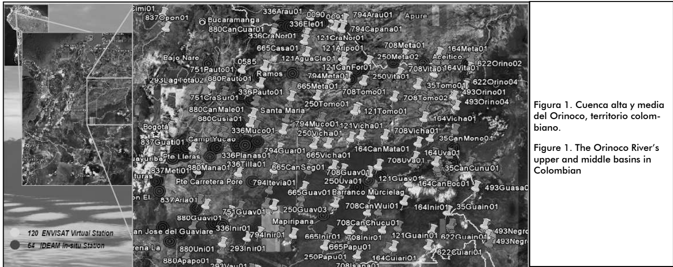
Figura 1. Cuenca alta y media del Orinoco, territorio colombiano.

upper and middle Orinoco basins in Colombia (Figure 1). The Orinoco River's 1,783 km length makes it the second largest river in South-America after the Amazon and the third longest in the world after the Congo. The Orinoco River and its tributaries represent the largest natural surface drainage system in eastern Colombia, in an area known as the Eastern Plains. The most important tributaries of the area are the Meta, Guaviare, Inirida and Vichada Rivers. Their overall contribution has been estimated at around 15,000 m 3 /s, accounting for nearly 50% of the Orinoco River's total flow to the Atlantic Ocean.