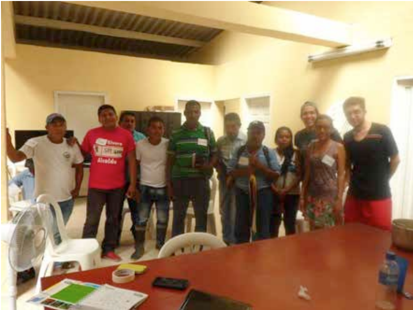
Foto 1. Taller de socialización con líderes del pueblo indígena Awá, realizado en el trabajo de campo. Llorente, municipio de San Andrés de Tumaco, 2014.