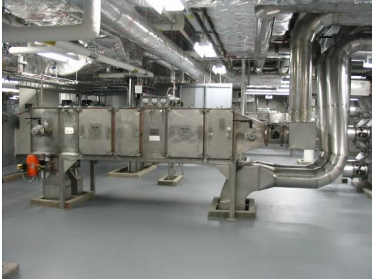
Figura 2. Filtro de aire HEPA de 3 etapas usado en el sistema de extracción de aire de un laboratorio de alta contaminación.