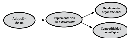
Figura 2. Modelo de adopción de e-marketing por mipymes mexicanas. Fuente: elaboración propia.

Identificados los factores críticos para la adopción de e-marketing por las mipymes mexicanas, se construye el modelo que puede explicar el fenómeno (figura 2).