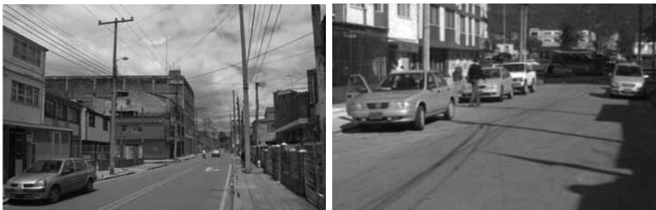
Figura 1. Superficies viales de investigación. a) Fontibón-Zona 1, y b) Barrios Unidos-Zona 2