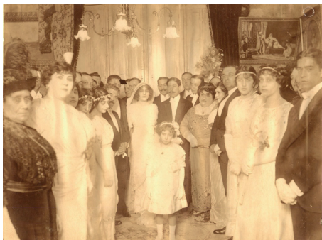
Figura 1. Boda de Delmira Agustini con Enrique Job Reyes. Hacia la izquierda de la novia, se encuentra Manuel Ugarte.

que se han sostenido las interpretaciones hace más de un siglo 3 .