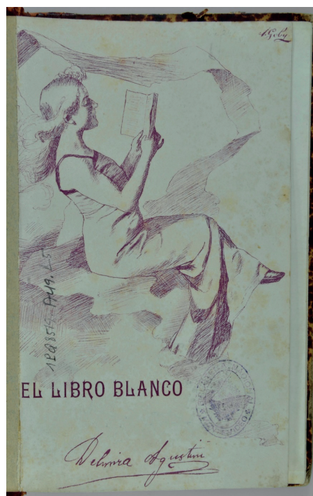
Figura 6. Delmira Agustini, El libro blanco , Montevideo, Orsini Bertani, 1907.

nombre de pluma” que permitiría distinguir a la poeta de la mujer y su estado civil, sino que, es el nombre finalmente elegido para determinar su lugar en el mundo. La “prueba” del matrimonio podría haber definido su aceptación del padre y de sí misma con su nombre y su genealogía. ¿Habrá descubierto Delmira en el breve tiempo de casada que no podía crear fuera de la casa paterna? Y, aventuro, contra toda evidencia fáctica, ¿que la vuelta a la familia era el paso necesario para crecer en su obra e independizarse realmente?