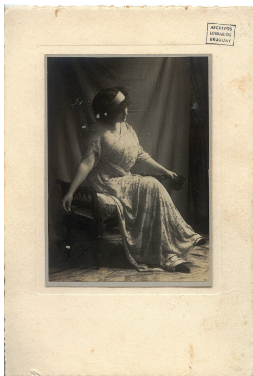
Figura 5. Delmira Agustini

Fuente: Colección Delmira Agustini, Archivo Biblioteca Nacional de Uruguay.