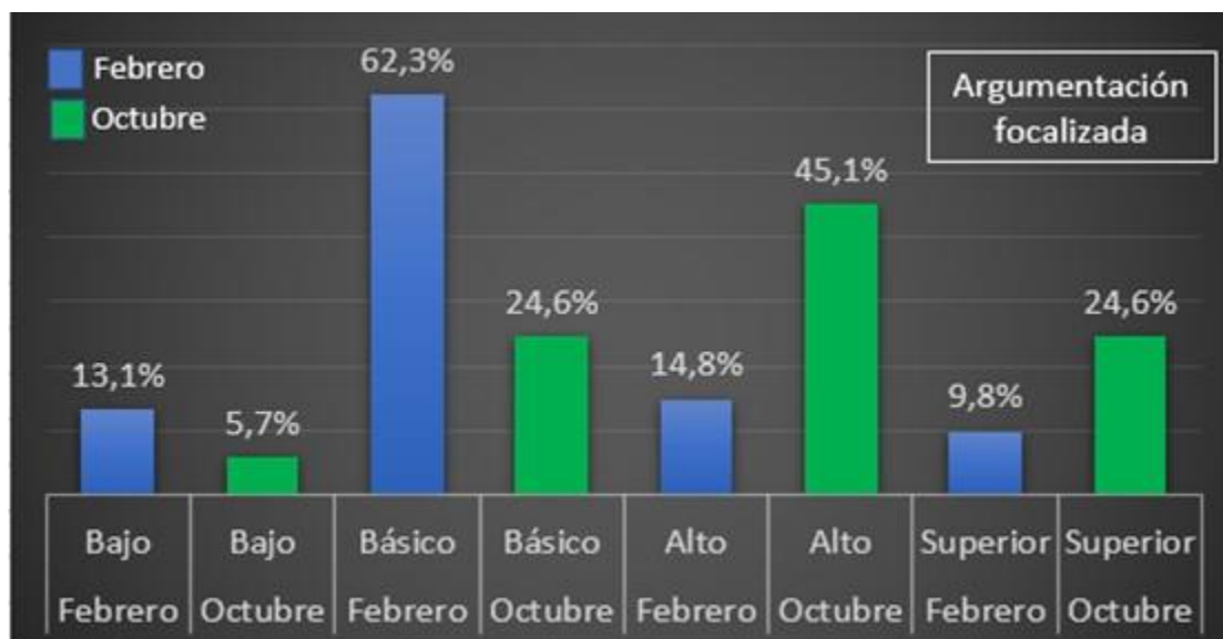
Figura 2. Balance de desempeños en Argumentación focalizada.