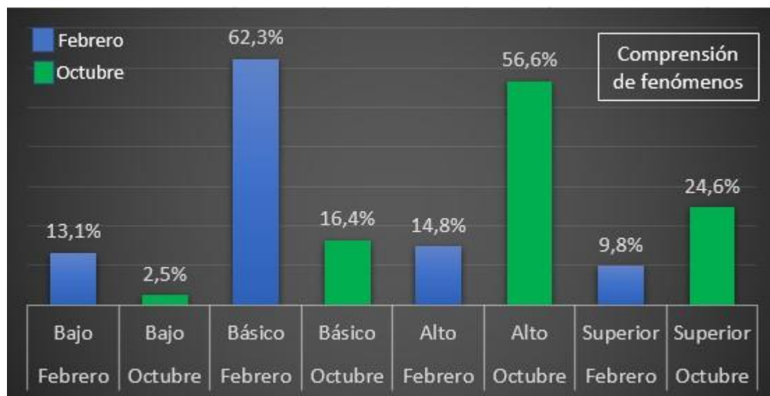
Figura 1. Balance de desempeños en Comprensión fenómenos.

El análisis de datos implementado en el cuarto bimestre de 2022 evaluó los tres procesos de literacidad crítica y recolectó percepciones sobre el proceso de aprendizaje adelantado en el año. Aquí se presentan las gráficas que sintetizan la evolución de desempeños (Figuras 1, 2 y 3) y los principales hallazgos.